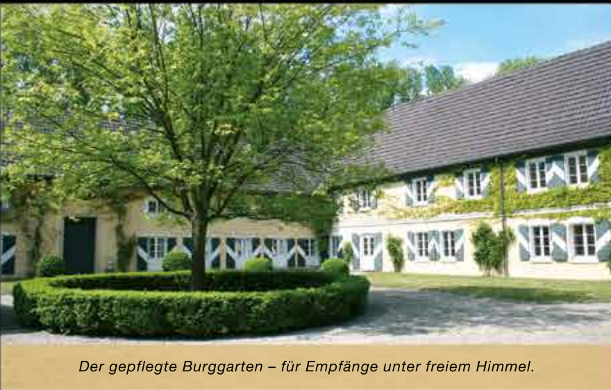
Der gepflegte Burggarten – für Empfänge unter freiem Himmel.

Stehempfang bis zur großen Tafel, die wir abgestimmt auf das Motto Ihres Events inszenieren. Feine Speisen und ein perfekter Service runden Ihre Feierlichkeit ab und geben Ihnen die beruhigende Gewissheit, Ihre Gäste in gute Hände zu begeben.