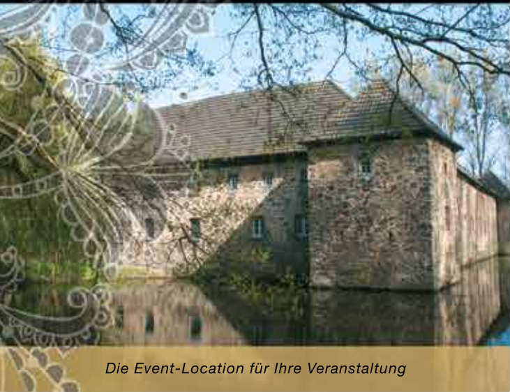
Die Event-Location für Ihre Veranstaltung

Wir machen Ihre Feier zu einem wahren Fest und freuen uns auf Ihre Anfrage.