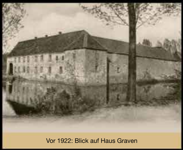
Vor 1922: Blick auf Haus Graven

Die Wasserburg im Langenfelder Stadtteil Wiescheid soll im 13. Jh. erbaut worden sein. Haus Graven ist ein U-förmiger Bruchsteinbau, der an drei Seiten von breiten Wassergräben umgeben ist. Bei dem heutigen Gebäude handelt es sich um die Mitte der im 17. Jahrhundert erbauten Vorburg, die an ihren Ecken hervortretende Viereckstürme mit Pyramidendächern besitzt. Der Siedlungsname Graven (Graben) fand 1334 zum ersten Mal urkundlich Erwähnung. 1994 bis 1996 wurde die Burg durch eine Privatinitiative vollständig restauriert. Seit 2011 ist Haus Graven auch für die Öffentlichkeit zugänglich.