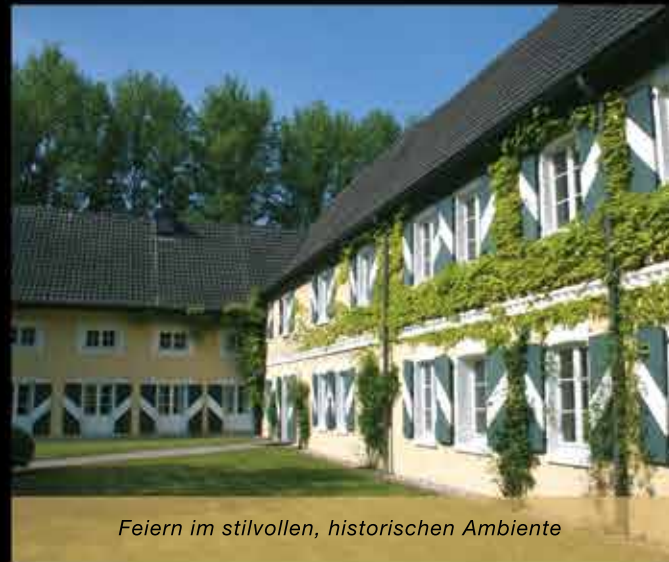
Feiern im stilvollen, historischen Ambiente